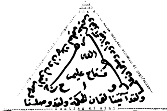
Gambar 3 85

Rajah dengan bentuk geometris segitiga terdapat pada azimat untuk menghafal Al-Qur'an yang berisi Q.S. Luqman [31]: 12, Q.S. Al-Hajj [22]: 59, Q.S. Al-Qasas [28]: 51, dan Q.S. An-Naml [27]: 15. 84 Rajah berbentuk segi empat memuat Q.S. al-Fātiḥah [1]: 1-7 yang ditulis dalam 7 x 7 buah persegi.