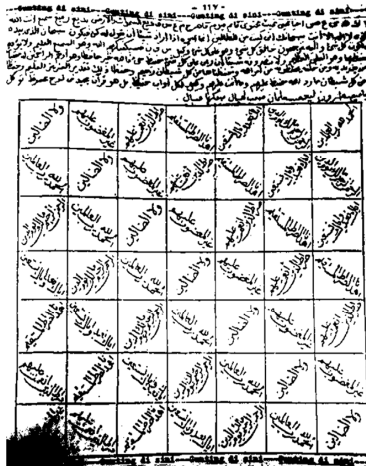
Gambar 4 86

Rajah dalam Tema Politik yang Berbentuk 7x7 Segi Empat